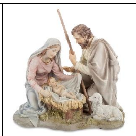
Б) Рождество Христово